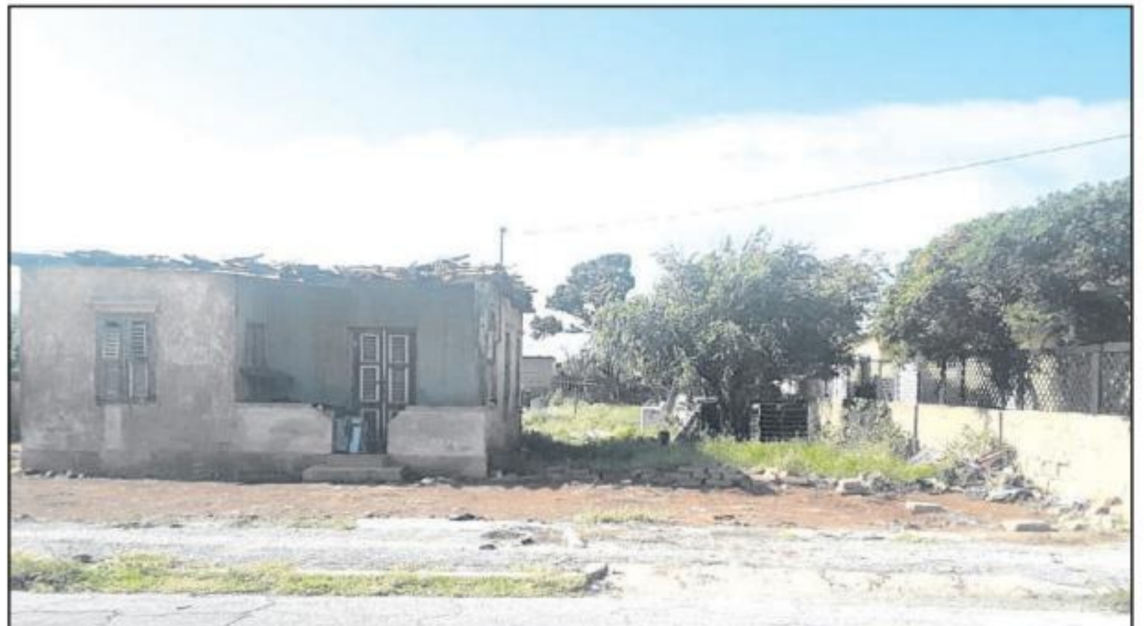
Ta trata di un cas den Isaac Wagemakerstraat. Bureau City Inspector hunto cu Infraruba, Serlimar y Departamento di

Asuntonan Social a logra papia cu e doño di e cas pa por logra haci e cas limpi, tanto paden y pafor mirando cu e hendenan aki tabata biba den un situacion inhumano. E cas aki tabata yen di desperdicio paden. Parti